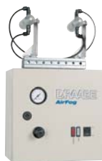
AirFog Compact con dos boquillas y unidad de control

AirFog Vario Easy es una unidad completa que se suministra lista para su conexión y un rápido montaje mural o de techo. Con un rendimiento de cómo máximo 140 kg/h (1 circuito de regulación con un máximo de 20 boquillas AF-1), este sistema resulta ideal cuando se requieren altos rendimientos de humidificación, y que al mismo tiempo se pretenden mantener reducidos los trabajos de instalación. Las consolas están disponibles con diferentes longitudes y con diferentes números de boquillas.