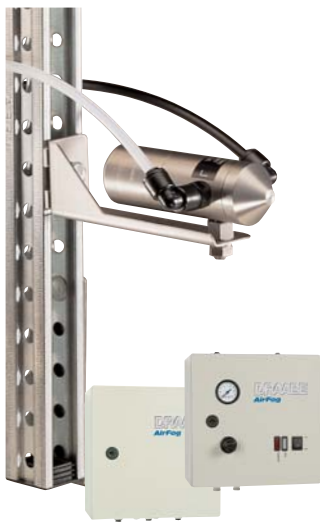
AirFog Vario con unidad de control, unidad de alimentación y boquillas AF-1 ubicadas individualmente

El sistema de boquillas de aire a presión AirFog se caracteriza por un sencillo manejo, unas posibilidades de aplicación flexibles y la boquilla de vacío autolimpiable AF-1. La sofisticada y robusta técnica garantiza un servicio fiable y de reducido mantenimiento.