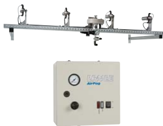
AirFog Vario Easy con unidad de control, consola y unidad de alimentación (válvula de vacío/aire principal)

Con la variante AirFog Vario se pueden conseguir por cada circuito de regulación unos rendimientos de 7 a 140 kg/h (1-20 boquillas AF-1). Las boquillas pueden ser ubicadas individualmente en el espacio en función de las necesidades correspondientes. Gracias a la estructura modular queda garantizada una óptima distribución de la humedad especialmente en locales grandes (o angulares) y en caso de humidificación de pistas de material. Los diferentes componentes del sistema están concebidos para montaje mural.